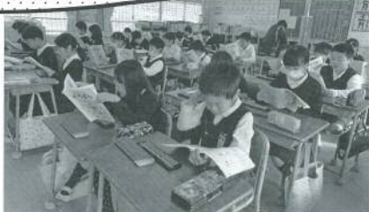
「たのしいそろばん」の教材を使って授業を受ける3年生

今年も小学校への派遣 事業も終わりに近づいて いる。過去の副教材「た のしいそろばん」の配布 数と「ボランティア派遣 学校数」は下記の表やグ ラフのとおりとなった。