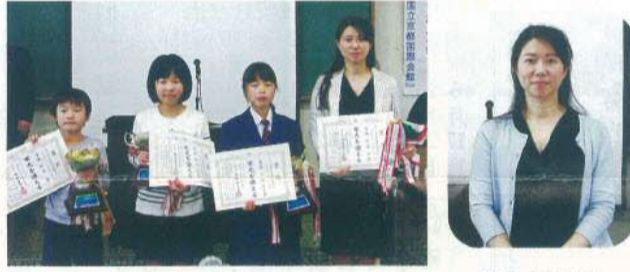
喜びの個人総合競技の部門優勝者

8月8日(木)京都市「国立京都国際会議場」で行われる全日本選手権大会の支部代表選考会を兼ねた、今年度になって最初の競技大会が開催され、注目の県代表の選手権の部をはじめ各部門で熱戦を繰り広げた。