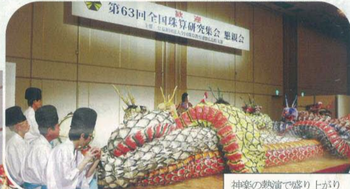
神楽の熱演で盛り上がり