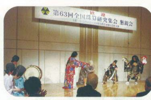
第63回全国珠算研究集会 懇親会