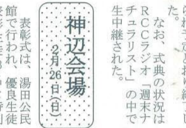
表彰式は、湯田公民館で行われ、優良生徒表彰生徒23名と特別

最後に、アトラクションも行われ、フラッシュ暗算やラッキーナンバー抽選会やジャンケン大会、最後に、保護者に感謝の花束が贈られ予定どおり終了した。なお、式典の状況はRCCラジオ「週末ナチュラリスト」の中で生中継された。