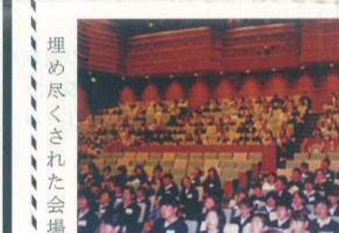
埋め尽くされた会場

その後、教室ごとに記念写真を撮り、引き続き、アトラクションが行われ、初めに体験する保護者もいて、驚いたり感心したりしていた。表情が印象的であった。また、ビンゴゲームなどをして楽しんだ。なお、今年も尾三・竹原地区からも参加があり引率された会員にはお手伝いをいただいた。