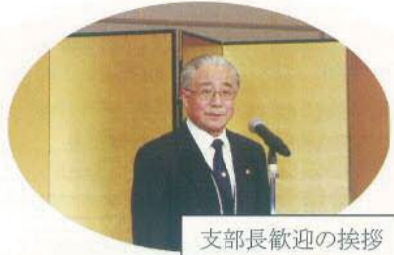
支部長歓迎の挨拶