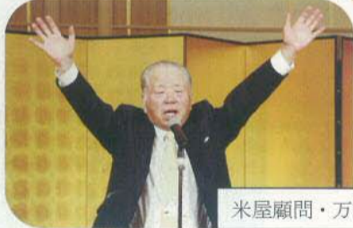
米屋顧問・万歳三唱