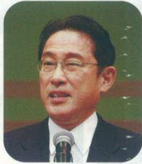
岸田文雄外務大臣(支部名誉顧問)の挨拶

広島県での開催は今回で3回目、7年ぶりとなるこの研究集会は、3月26日(日)広島市中区の「上野学園ホール」で開催され、全国から700名を超える珠算の会員が受講した。開会式には、支部名誉顧問の岸田文雄外務大臣・河井克行内閣総理大臣補佐官も多忙の中駆けつけ、温かい励ましのことばをいただいた。当日は、予報では雨模様となっていたが天気は穏やかで絶好の研究集会の終日であった。また、前日は「県民文化センター」で午後2時から「珠算教養講座」が行われ、400名弱の珠算会員が受講、いずれの研修会も研鑽に励む全珠連の同志で熱気にあふれた。なお、臨時総会などの一連諸会議が24・25日の両日に亘り、広島市まちづくり市民交流プラザ(中区袋町)で開催され、連盟の今後の方針等が協議された。