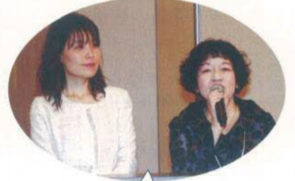
わざわざ司会進行役は プロ顔負けと好評であった