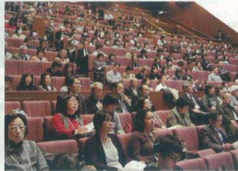
受講者で埋まった教養講座会場の県民文化センター