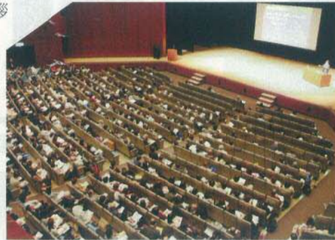
上野学園ホールに全国から700余名の受講者が参集