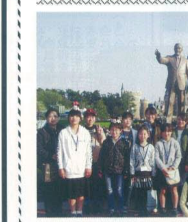
今年で19回目となった修学旅行は4教場の33名が参加した。25日夕刻7時にバスで広島を出発。翌朝、定刻より早く6時半に目的地のディズニーに到着した。開演は8時、到着時間が早い分、開演前の列も早く並び、お土産の購入にも活発に動き回り、疲れ知らずには驚かされた。この日は、穏やかな天気にも恵まれ、シンデレラ城を舞台にした物語に、あふれるディズニーの世界とプロジェクションマッピングが生み出す、愛と感動に満ちたナイトエンターテインメントの映像がとて印象に残った旅であった。

その後、教室ごとに記念写真を撮り、引き続き、アトラクションが行われ、初めに体験する保護者もいて、驚いたり感心したりしていた。表情が印象的であった。また、ビンゴゲームなどをして楽しんだ。なお、今年も尾三・竹原地区からも参加があり引率された会員にはお手伝いをいただいた。