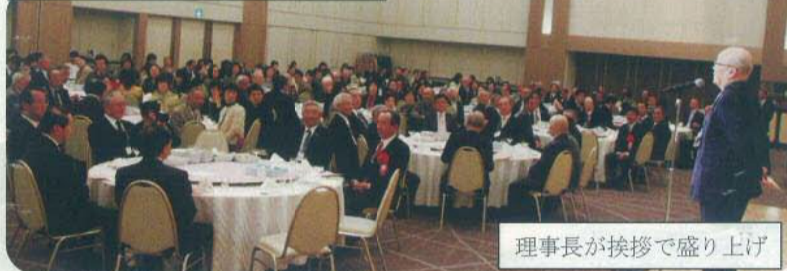
理事長が挨拶で盛り上げ