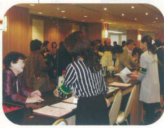
懇親会は大混雑の受付風景

連盟の2大事業である研究集会は、昨年の愛知大会を100名も上回る参加者を得て開催された。研究集会の模様をスナップで追ってみた。