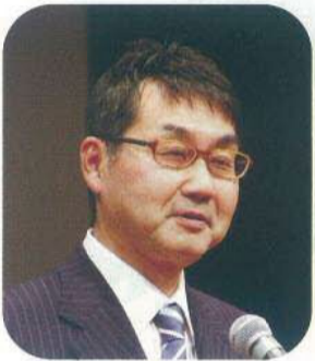
河井克行総理大臣補佐官(支部名誉顧問)の挨拶