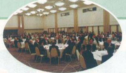
盛況であった懇親会会場