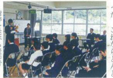
謝辞を述べる表彰者

県民文化センターふくやまで、来賓を迎え表彰生徒119名、多数の保護者が見守る中で開催された。表彰は、氏名がステージの画面に映し出され、一人ずつ壇上上がり、表彰状と記念品のトロフィーが手渡された。厳かな中、子ども達は緊張の面持ちで表彰式が行われた。