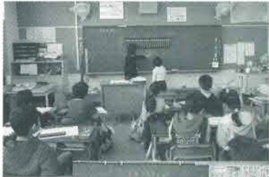
全員の目が集中 5の合成