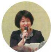
すばらしい司会進行役で式典が盛り上がった。