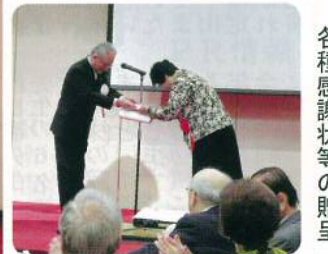
各種感謝状等の贈呈