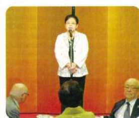
伊藤副支部長による祝賀会開会のことば