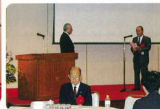
台井先生による謝辞