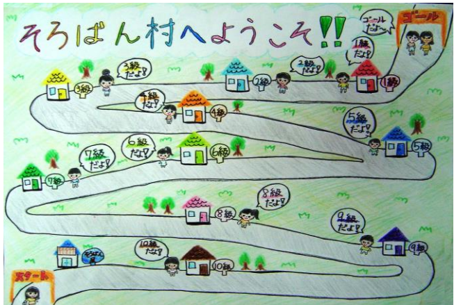
審査員賞 北川 空