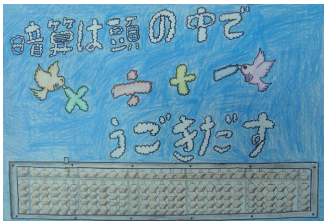
優秀賞 志船 十和