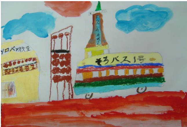
審査員賞 脇坂 耕平