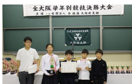
優勝：けいはん計算アカデミー