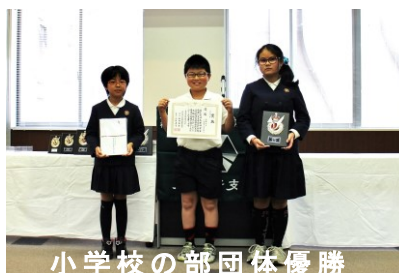
小学校の部団体優勝