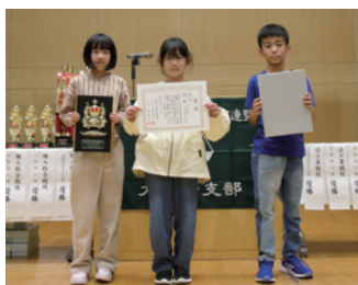
小学校4年生以下の部