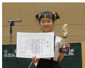
小学校4年生以下の部