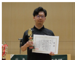
高等学校・一般の部