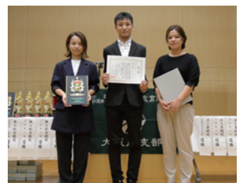
高等学校・一般の部