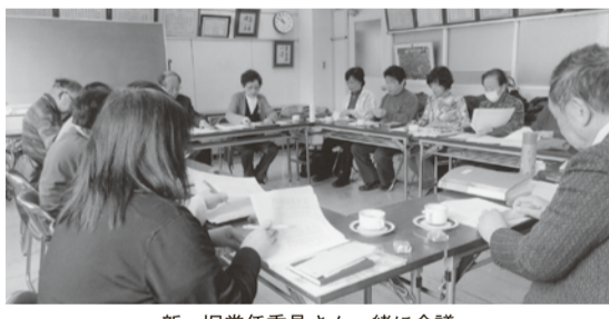
新・旧常任委員さん一緒に会議