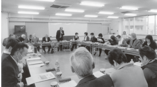
顧問・参与・常任委員・地区長の各先生方真剣に討論

珠算・暗算段位検定試験 制度改正のお知らせ 準五段・準六段が追加されます。第380回(H29.7.23)の検定試験より実施。(詳細は送付)