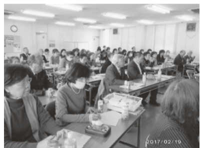
多数の先生方が熱心に受講

姿勢が悪い、不器用、対人関係がうまく築けない事等は、時間的、精神的にゆとりがない親が待つ事が出来ないうちに「ため」のない子育てをしていける結果で、社会システムの問題である事。多動傾向や自閉スペクトラム傾向の子どもの増加についての説明の後、では、どうしたら?と考える進みます。 日本の伝統的な読み、書き、計算の技の指導の工夫や、保護者への働きかけ時の「一つを再考出来た一日でした。良い機会をいただき、ありがとうございます。」という、優しい言葉で