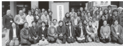
貸切りバスで3月26日(日)早朝出発 54名が参加 = 広島市上野学園ホールにて

第六十三回全国珠算研究集会に参加して 日頃、塾の子どもたちと向き合うことで練習方法を、含め、どう対応していったら良いかと迷っていました。そんな時に今回の研究集会に行ってみませんかというお話をいただき学ばせて頂こうと思われました。研究集会前日の指導者教養講座では対応のコツとして大人の「心のゆとり」が大切だと習いました。最後に