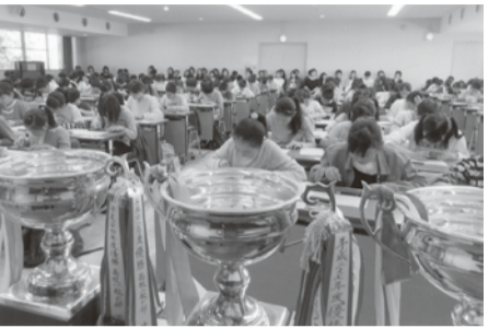
各競技で熱戦を繰り広げる162名の選手たち